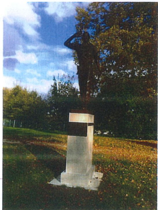
Statue du Général BIGEARD, square en montant vers la gare à TOUL